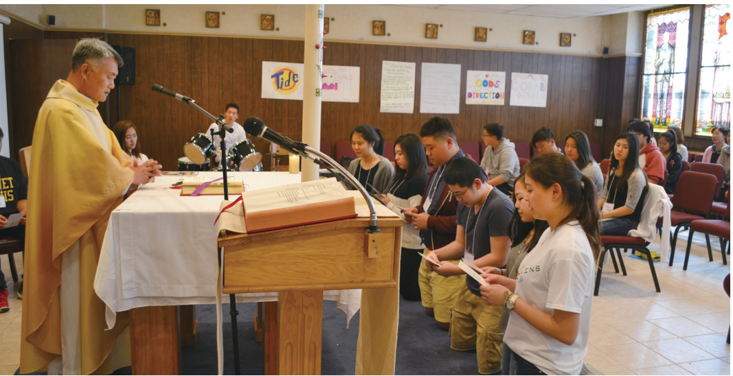
‘RYC New Beginning 피정’ 참가자들이 RYC 다섯 가지 행동목표를 읽으며 서약하고 있다.

【뉴욕】 RYC 청소년 사목센터(지도신부 백운 스토니 포인트에 있는 돈보스코 피정센터에서 텍 어거스틴)는 지난 15일(금)부터 17일(일)까지 고등학생 9학년에서 12학년을 위한 ‘RYC New